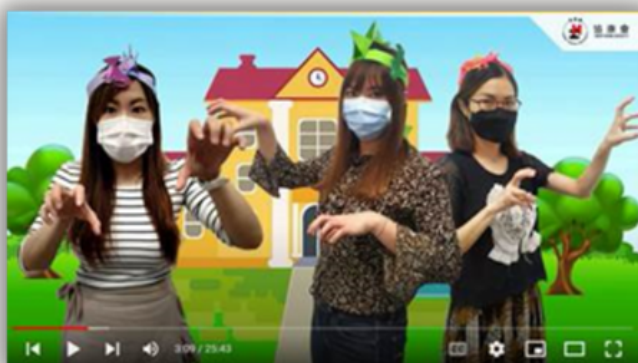
《故事短講——感恩我有你》