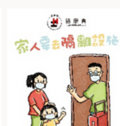
《家人要去隔離設施》