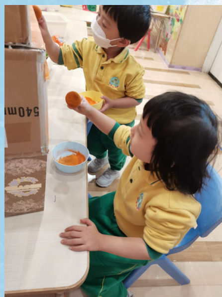
幼兒在為「馬」塗上水彩顏料。