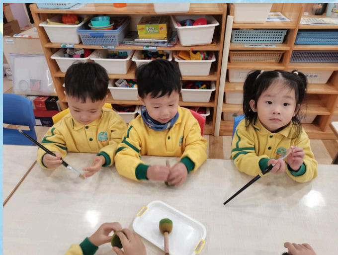
幼兒在觀察各種塗顏料的工具。