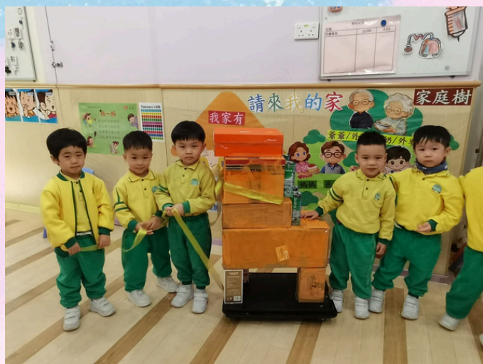
完成了，大家一起拉「頭馬」。