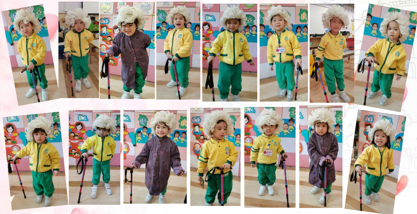
長輩老了，頭髮會變白，有時會腳痛，所以要拄拐杖慢慢走路。