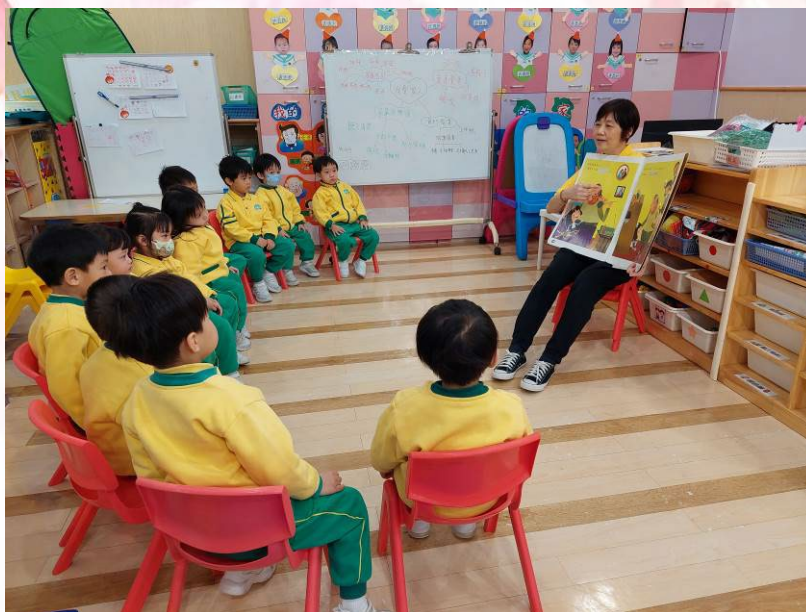
老師和我們一起重溫主題故事「請來我的家」