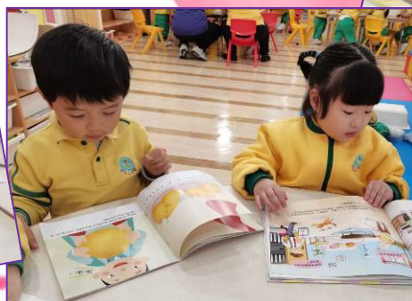
我們在典故中學習如何孝敬長輩