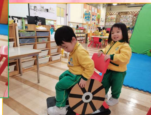
當他們走不動時，可以坐輪椅，我會推著他們走出去，看看外面的世界。