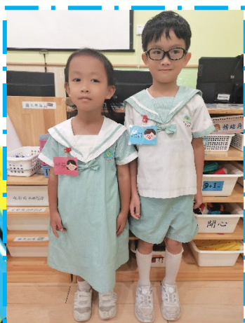
今天由我們來當班長