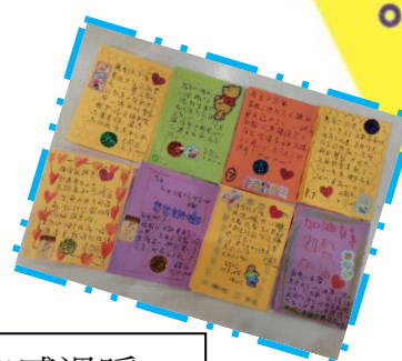
紀念冊有校長主任和各位老師、同學的留言，讓人倍感溫暖。