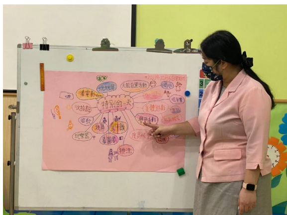
幼兒為主題網填色和繪畫圖畫。

「迪迪的一天爸爸」的主題是家庭組合。主題書的內容是關於迪迪在單親家庭長大。一次，學校舉行親子運動會，迪迪媽媽邀請了四個叔叔擔當迪迪的爸爸參加不同的親子比賽，最後迪迪拿了冠軍。讓幼兒知道世界是有很多不同的家庭組合，而他們生活都十分開心。從不同的主題活動中，他們知道父母很偉大。他們都想做一些行動去多謝爸爸媽媽，所以是次延展專題研習活動的主題為「感恩 Daddy Mammy」，與幼兒一同以行動答謝父母。