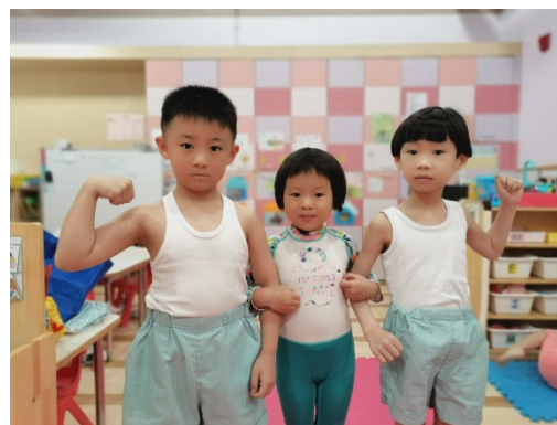
幼兒穿上泳衣，表演精彩的泳衣 SHOW。