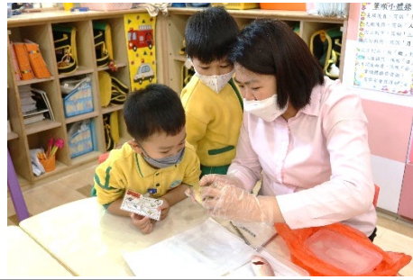
老師給幼兒看魚鰓是怎樣的。