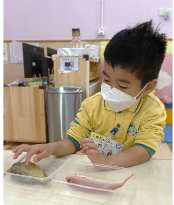
幼兒一起透過看一看、摸一摸，感受不同的魚鱗。