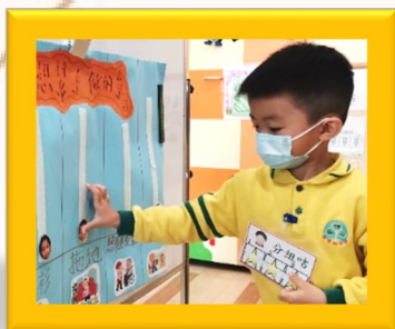
我投票幫媽媽拖地。