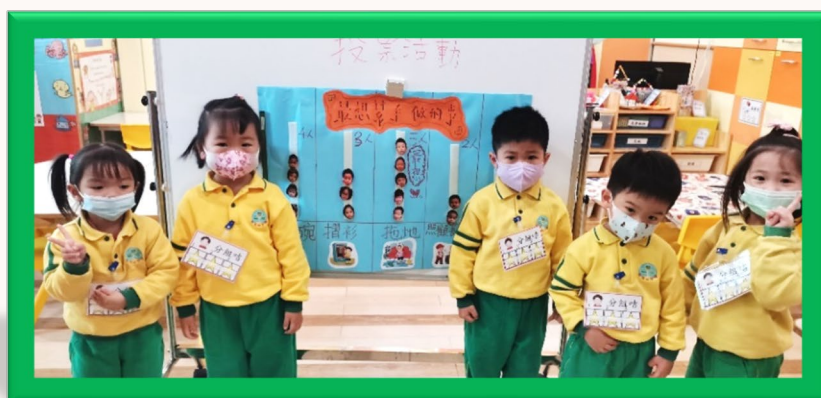
我們都投完票啦！結果是：最多人想幫忙拖地。