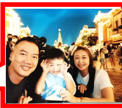
爸爸、媽媽同我去迪士尼玩，我好開心。爸爸、媽媽愛我。