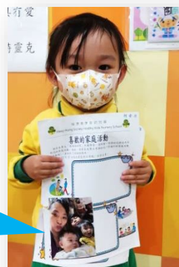
爸爸、媽媽和弟弟陪着我，我都好開心。爸爸、媽媽、弟弟愛我。