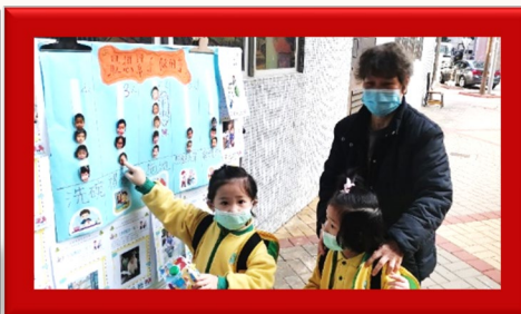
放學了，快點把投票結果告訴我的家人。