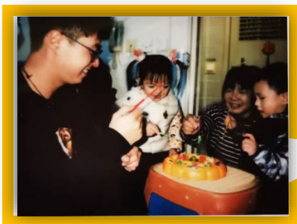
爸爸、媽媽和奶奶同我食生日蛋糕，好愛我。

經過上一個活動後，幼兒對家人的稱謂有了進一步的認識。有一位幼兒興奮地介紹着自己的媽媽，然後說：「媽媽愛我！」幼兒都十分雀躍，一起討論家人是怎樣地愛自己。經過一番商討，最後大家決定，幼兒先完成「家庭活動」工作紙，然後回校分享家人為幼兒而進行的家庭活動。過程中幼兒表現得興奮與自豪。因為分享照片時，大部分幼兒都能說出家庭活動的情景，從中感受到家人的關愛。