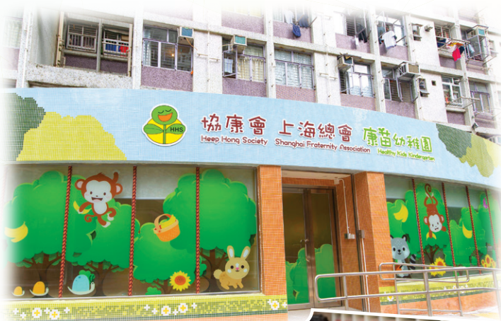
協康會上海總會康苗幼稚園，已現投入服務。