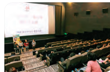
三位家長分享照顧自閉兒的感受

當天電影放映完畢後，家長熱烈鼓掌以示支持，隨後三位家長與大家分享照顧子女的點滴。有爸爸辭去工作，全職照顧9歲的自閉症兒子，他留意到兒子懂得在家人患病時給予關心，令他感受到自閉症小朋友亦有可塑性，家長應陪同他們一同學習，一起成長。