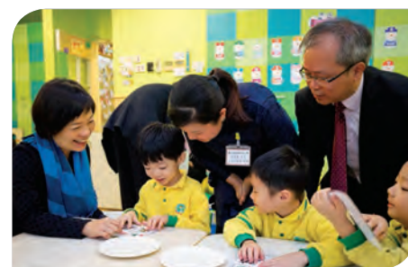
教育局副局長蔡若蓮博士與學童一起互動遊戲·並與職員交流教學心得