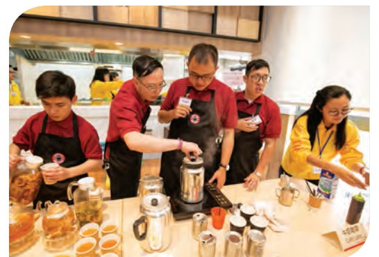
星亮餐廳配備廚房及烘培設施，提供餐飲業培訓及實習機會予計劃學員

有興趣參與賽馬會「啟程·職聘」支援計劃的青年及家長，或有意提供實習機會的僱主，歡迎致電3158 8359查詢及報名。