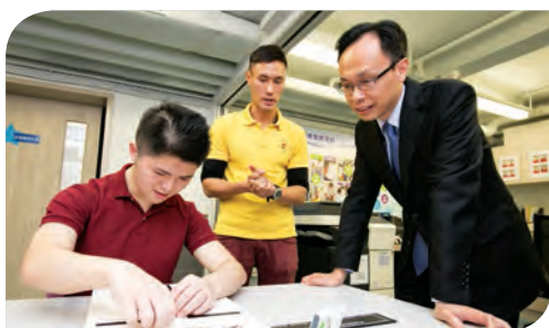
政制及內地事務局局長聶德權先生觀看星亮職訓學員示範職能評估過程

此外·教育局副局長蔡若蓮博士亦於2017年12月5日探訪康苗幼兒園·了解幼兒園服務和觀察學童上課情況·並與職員交流教學心得。蔡副局長表示·欣賞幼兒園的課程·能照顧學童的全人發展·給予他們愉快的學習經驗。她又讚揚同事用心教學·表現專業·並勉勵他們繼續為孩子提供優質的幼兒教育服務。