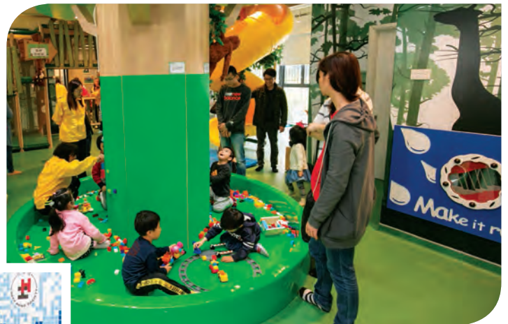
賽馬會青蔥樂園暨家長資源中心，深受兒童歡迎