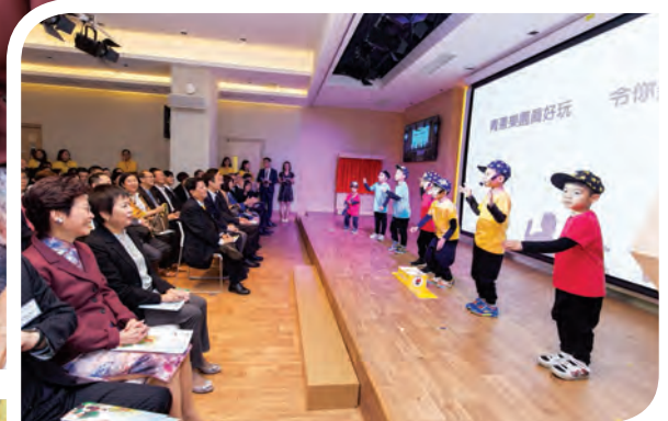
何善衡慈善基金會贊助何善衡堂，可作典禮及表演場地，或舉辦各類社區適應訓練活動，幫助學童融入社區生活