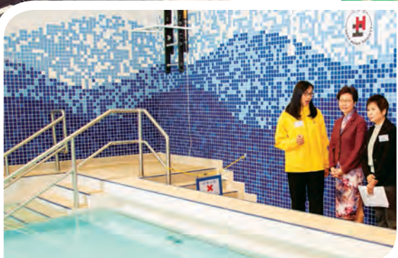
賽馬會水療池為兒童提供水療訓練及親子水療班