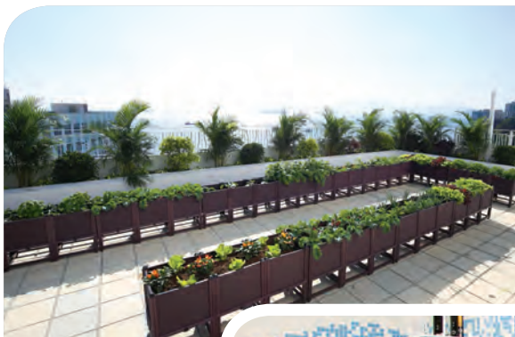
景色怡人的賽馬會空中花園