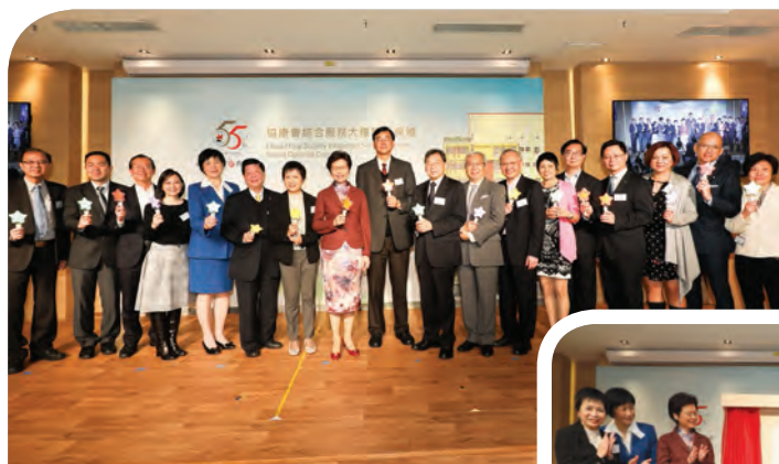
開幕禮上同時舉行協康會55周年亮燈儀式

計劃』又去到另一個轉捩點……我可以跟大家說，今日我仍然有決心做到「零等候」時間，那怕需要的位置不止七千個，亦不止四億六千萬，但是為了小朋友的健康成長，特區政府是願意作這個投入的。」