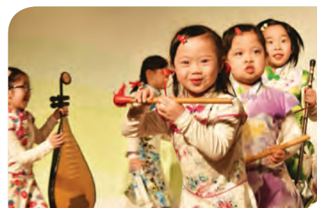
學童的精彩表演為典禮增添不少生氣，台下嘉賓讚不絕口