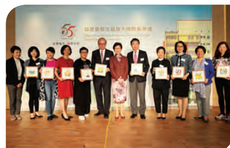
行政長官頒贈紀念品予各慷慨解囊的機構及善長