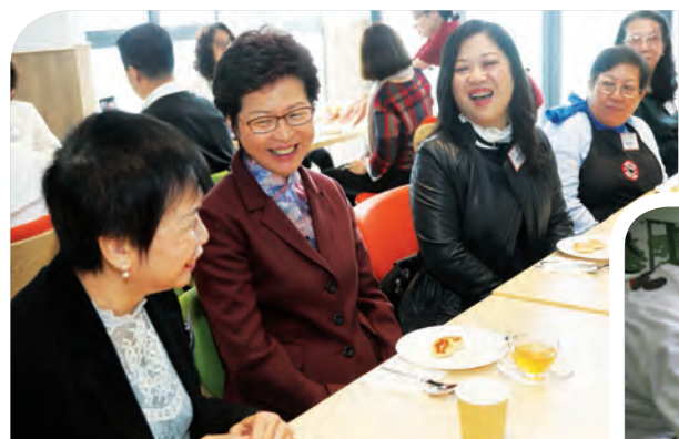
行政長官與家長及協康會行政總裁談笑甚歡

綜合服務大樓同日下午舉行開放日，招待中心兒童、舊生及家長參觀。他們急不及待試用大樓各項設備，更讚賞嶄新設施能切合不同能力兒童及青年的需要，期望能多參與大樓舉辦的活動，將來孩子也有多一個好去處。