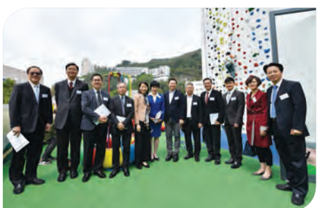
勞工及福利局、社會福利署一眾官員參觀大樓設施