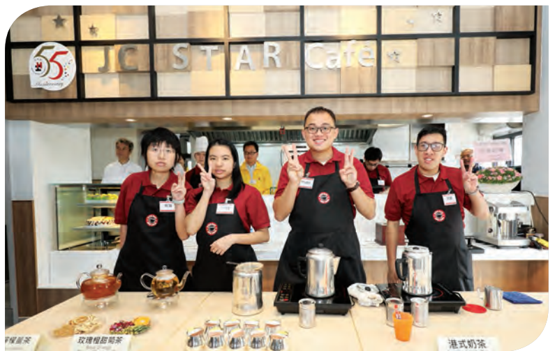
學員悉心為客人準備各式飲品