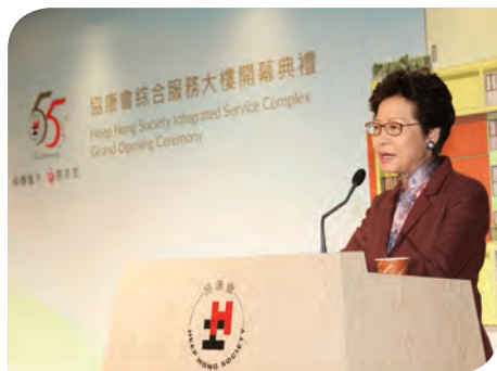
行政長官讚賞小朋友表演時，一度感觸落淚