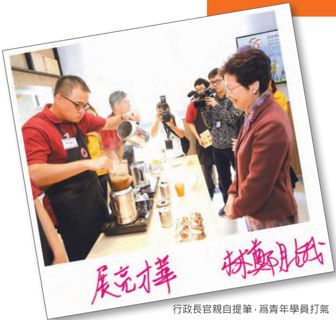
行政長官親自提筆，為青年學員打氣