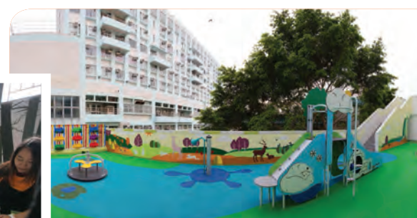
兒童及家長下午開放日享用大樓內各項設施