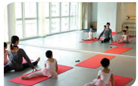
社區支援中心內設有多用途室，提供各種活動