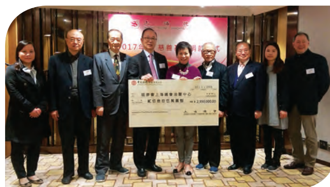
上海總會向協康會頒贈支票，資助「協康會上海總會油麗中心」

上海總會於1月23日在其會所舉行「2017年度慈善基金捐款儀式」，向協康會頒贈支票，資助「協康會上海總會油麗中心」，以增設各類新穎的訓練設施，包括音樂創意視藝室及兒童家長資訊天地。上海總會同時也資助本會東九龍6間中心的社區適應活動及興趣小組，擴闊兒童的社區生活體驗，提升自理及社交溝通技巧，同時亦幫助他們融入社區生活。而其家長亦透過中心獲得不同支援，協助及紓解照顧小朋友的壓力，讓家長重拾力量。最近，上海總會更落實捐助協康會開辦康苗幼稚園葵芳分校，投入更多資源於幼兒教育。