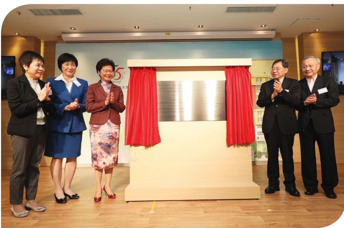
(左起) 協康會行政總裁曾蘭斯女士、協康會董事會副主席陳黃怡女士、行政長官林鄭月娥女士、協康會董事會主席尹錦滔先生、聯同副主席傅高亭先生為協康會綜合服務大樓牌匾揭幕

綜合服務大樓由籌備至落成需時近10年，重建費用逾1億6千萬元，是獎券基金資助下第一個完成的「私人土地作福利用途特別計劃」項目，承擔逾九成支出。政府各個部門也在重建過程中給予全力支持。香港賽馬會慈善信託基金亦慷慨撥款，捐助非政府資助項目的建築裝修、特別設備和青年職訓計劃。