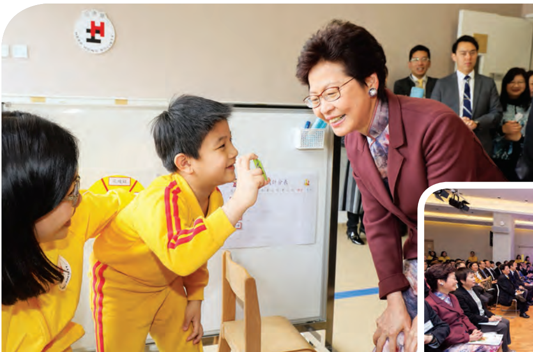
行政長官參觀綜合服務大樓設施及服務，與學童互動交流