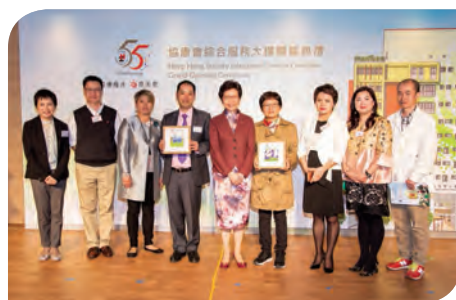
同心家長會歷屆主席代表700多位捐獻的家長接受紀念品