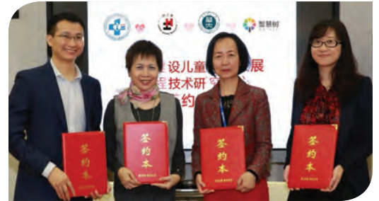
協康會與廣州市婦女兒童醫療中心、華中師範大學，以及北京環宇萬維科技有限公司達成戰略合作協議

協康會很高興獲邀請參與建設工程中心，期望與各方分享累積多年特殊兒童早期干預和教育的經驗，全力參與工程中心的研究工作，提升技術水準，推動師資培訓和家長教育。