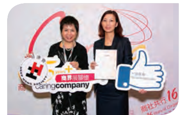
港島香格里拉大酒店