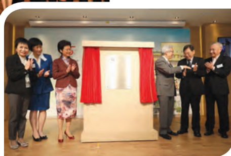
各主禮嘉賓為香港賽馬會慈善信託基金捐贈牌匾揭幕