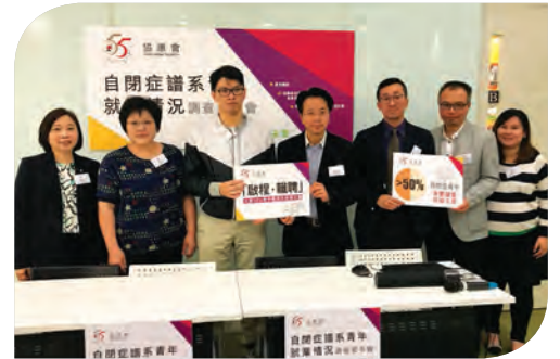
協康會發布「自閉症譜系青年就業情況」調查

協康會於今年二月完成一項問卷調查，了解自閉症譜系青年的求職及就業情況，發現受訪者中雖然全部中學畢業，半數更具備專上學歷，卻只有不足5成受訪青年能維持一份工作超過一年；即使有7成受訪青年曾接受過就業訓練，但當中不足4成曾接受跨專業團隊介入的就業支援服務。協康會另外訪問27位僱主，他們當中約7成曾經或正在聘用自閉症人士，大部分認同他們有良好的工作表現，當中44%認為有需要增強員工對自閉症人士的了解。此數據反映大部份聘用自閉症員工的僱主，認為自己對自閉症人士的認識仍有不足。